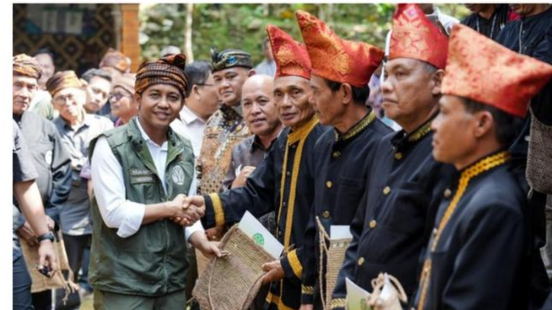
Penyerahan SK Penetapan Hutan Adat kepada masyarakat hutan adat di Hutan Adat Kesepuhan Pasir Eurih, Bogor, Sabtu (6/6/2026).