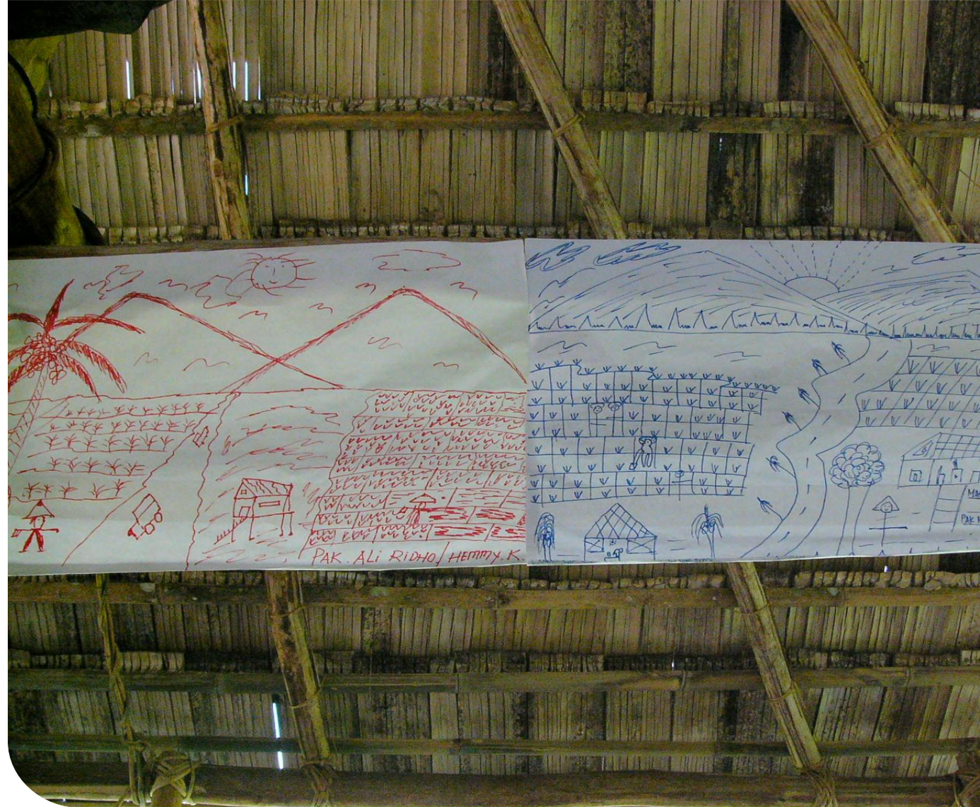
Foto dokumentasi pribadi dari proses fasilitasi Perempuan adat di Sulawesi Tengah, 2003