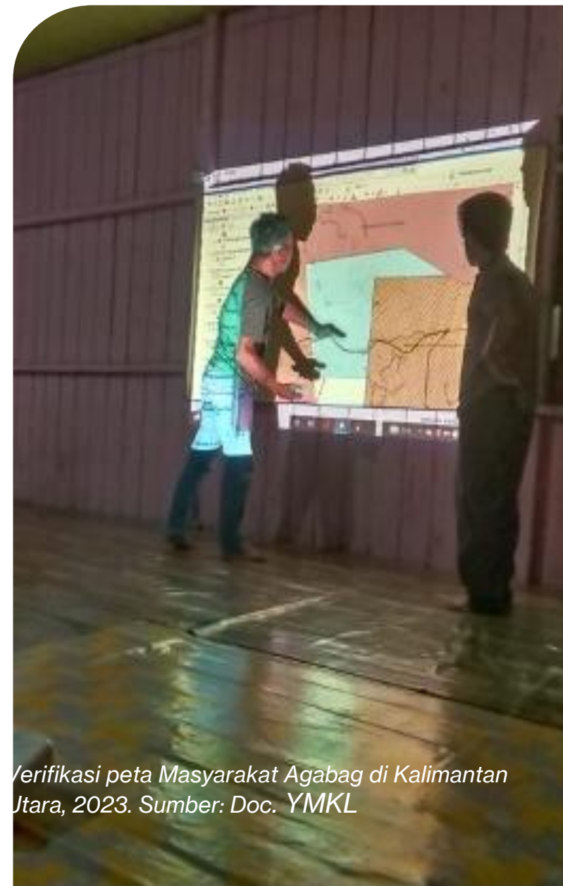
Verifikasi peta Masyarakat Agabag di Kalimantan Utara, 2023.